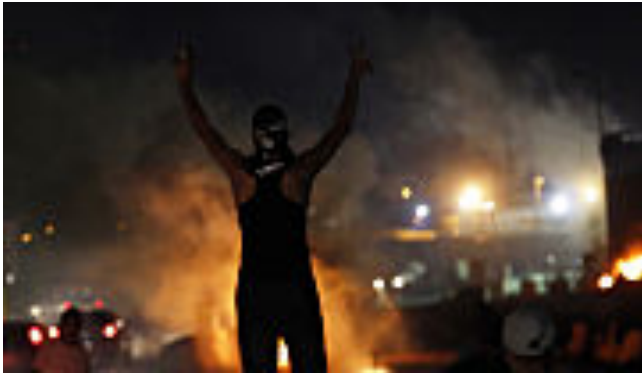
( http://www.slate.fr/story/89889/israel-palestine-derniere-chance )

La dernière chance d'Israël et de la Palestine