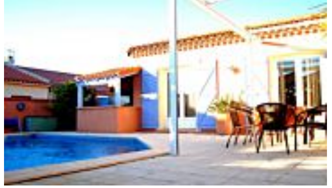
( http://france3-regions.francetvinfo.fr/haute-normandie/2014/07/31/une-famille-de-haute-normandie-victime-d-une-arnaque-la-location-saisonniere-525774.html )