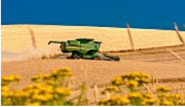
( http://www.slate.fr/story/89513/menages-depenses-nourriture )