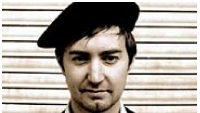
( http://www.timeout.fr/paris/quoi-faire-a-paris/75-phrases-que-vous-nentendez-jamais-dans-la-bouche-dun-parisien )

75 phrases que vous n'entendez jamais dans la bouche d'un parisien ( http://www.timeout.fr/paris/quoi-faire-a-paris/75-phrases-que-vous-nentendez-jamais-dans-la-bouche-dun-parisien )