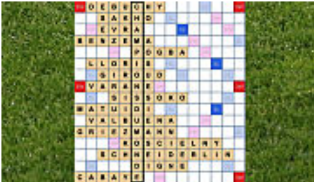
( http://www.slate.fr/story/89819/coupe-monde-finale-illustration-scrabble )