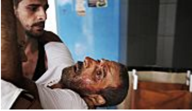
( http://www.slate.fr/story/90085/gaza-manoevres-fatales-israel )