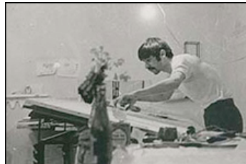
میرحسین موسوی در جوانی و در حال طراحی یک پروژه معماری

در انتخابات ریاست جمهوری سال های ۶۸ و ۷۲ اکبر هاشمی رفسنجانی کاندیدای تقریباً بلا منازع بود و در انتخابات نیز پیروز شد؛ اما در انتخابات سال ۷۶ سیاستمداران جناح چپ جمهوری اسلامي که به دنبال کاندیدایی برای رقابت با اکبر ناطق نوری، رئیس وقت مجلس و نامزد جناح محافظه کار، بودند ابتدا به سراغ میرحسین موسوی رفتند.