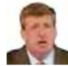
PATRICK KENNEDY (Dém.) Ancien membre du Congrès