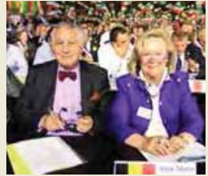
Sid Ahmed Ghozali, ancien premier ministre algérien, et Anne-Marie Lizin, présidente honoraire du sénat belge.