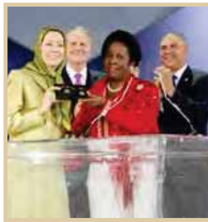
Sheila Jackson Lee remettant une médaille à Maryam Radjavi

Demain viendra quand les flammes de la liberté s'allumeront dans les âmes de tous les Iraniens et que les murs de l'oppression tomberont, parce que nous n'allons pas disparaître dans l'obscurité de la nuit. Nous n'allons pas disparaître sans nous battre. Notre cause est juste. Nos motifs sont justes. A bientôt dans un Iran libre !