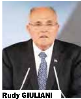
Rudy GIULIANI Ancien maire de New York

Le rassemblement d'aujourd'hui est la réponse la plus déterminante et la plus forte à cette élection. Il dit que la dictature religieuse au pouvoir en Iran ne représente pas en fait le peuple iranien , et si vous voulez voir qui représente le peuple iranien, regardez des gens comme Madame Radjavi qui représente en fait les aspirations de son peuple à la liberté , à la démocratie, à la liberté des femmes et aussi des hommes. » Linda Chavez