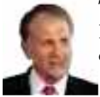
TED POE (Rép.) Président de la commission du Contre-terrorisme