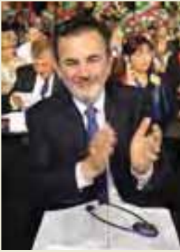
Jean-François Legaret, maire du 1er arrondissement de Paris