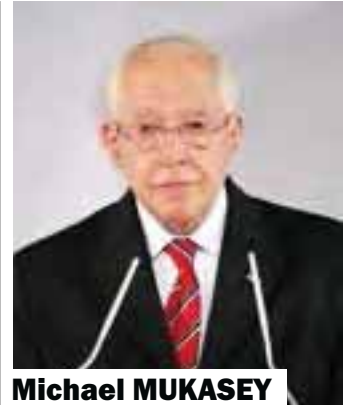
Michael MUKASEY Ancien ministre de la Justice