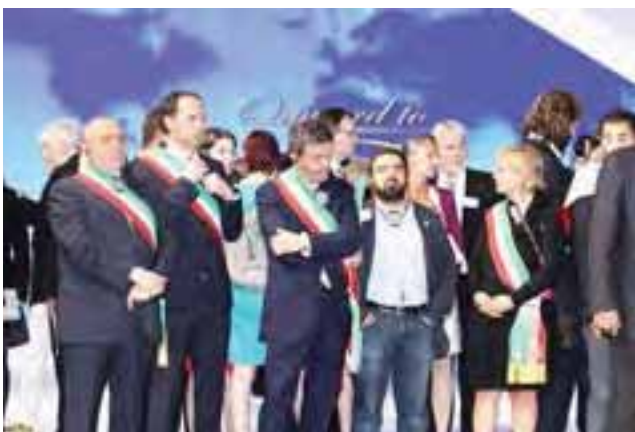
La délégation italienne

La complicité révélée des gouvernements iraniens et irakiens visant le but commun de réprimer la résistance iranienne, aurait pu être arrêtée s'il y avait eu un accord fort entre l'ONU et les USA. Ceci doit changer !