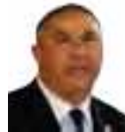
WILLIAM LACY CLAY (Dém.) Membre du Congrès

Il y a quelques jours, le camp Liberty a été touché par environ 20 roquettes, tuant des civils et une attaque en février a tué six personnes et en a blessé des dizaines.