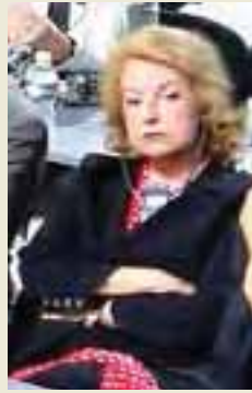
Anissa Boumediene, ancienne première Dame d'Algérie