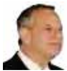
BOB FILLNER (Dém.) Ancien congressman, Maire de San Diego

Concessions et négociations ont mené à plus de répression et de terrorisme.