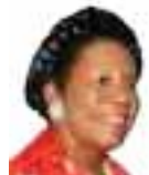
SHEILA JACKSON LEE (Dém.) Membre du Congrès

Nous posons la question de savoir où nous ont menés trois décennies de concessions, de négociations et de complaisance des républicains et des démocrates ? A davantage de répression, de terrorisme, et de programme nucléaire. C'est pourquoi, nous sommes avec vous contre toute nouvelle complaisance. Nous sommes avec vous pour un Iran libre. Nous sommes avec vous et avec Mme Radjavi pour mettre fin à cette tyrannie maintenant.