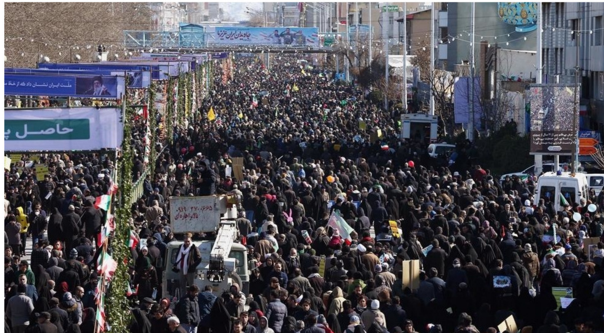
Des milliers d'Iraniens sont descendus dans les rues de Téhéran pour commémorer l'anniversaire de la victoire de la révolution islamique ce mardi 11 février 2020

Publié le : 11/02/2020 - 13:30 Modifié le : 11/02/2020 - 14:14